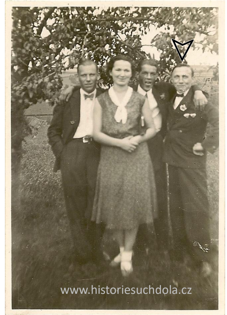
Lysolaje, 9. 8. 1931